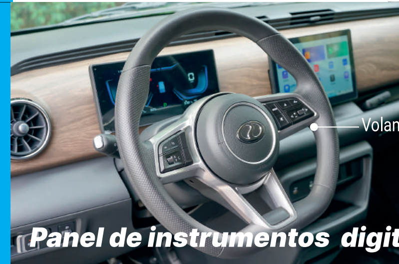
Panel de instrumentos digital

La nueva SuperVAN eléctrica de DFSK, más amplia y con mayor capacidad de carga que la hace la mejor herramienta para el transporte y reparto.