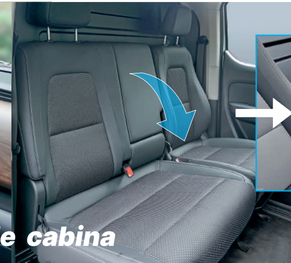
Amplia y comfortable cabina

Pantalla táctil multimedia con conexión Bluetooth, cámara trasera, cámara delantera, pack multimedia Radio, USB, video.